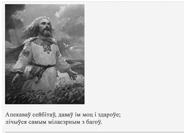
Мал. 4. Выява

У заданні «Пазнай язычніцкіх багоў» рабочага аркуша змешчаны выявы багоў, падказка і заданне «Адкрытае пытанне». Вучням патрэбна запісаць імёны міфічных персанажаў (мал. 4).