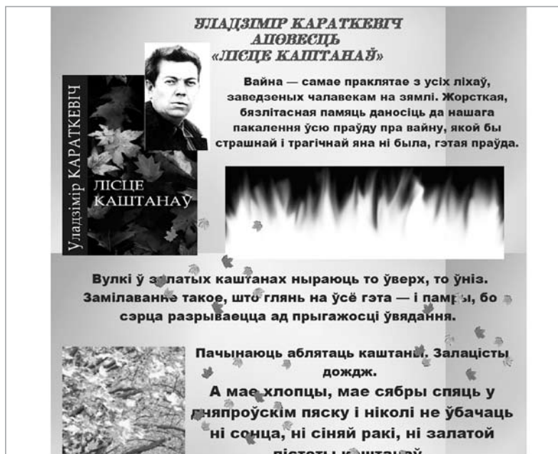
Плэйкаст. Уладзімір Караткевіч. «Лице каштанаў».

Прымяненне наглядных і тэхнічных сродкаў навучання не толькі спрыяе эфектыўнаму засваенню адпаведнай інфармацыі, але і актывізуе пазнавальную дзейнасць вучняў, развівае ў іх здольнасць звязваць тэорыю з практыкай, фарміруе навыкі тэхнічнай культуры, павышае цікавасць да навучання і робіць яго больш даступным.